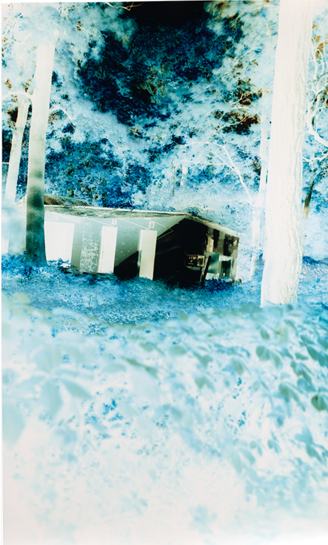
JOHN CHIARA Variation, Népsziget u. on Népsziget island, Budapest, Hungary, 2019 Photographie négative sur papier Fujiflex Crystal Archive 50x30 inches / 127 x 76 cm Signée et datée au verso par l'artiste Unique