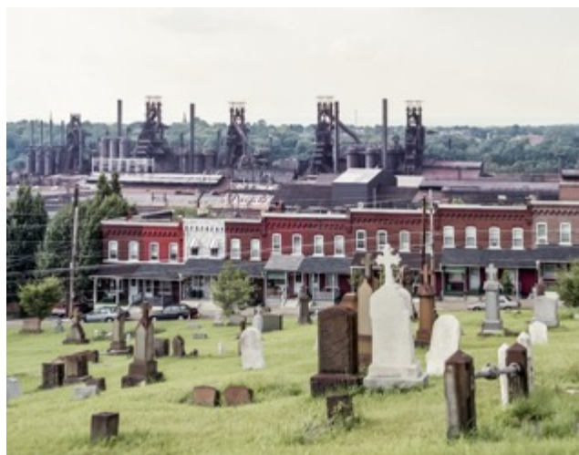
GERARD DALLA SANTA

2 tirages au chlorobromure d'argent sur papier baryté (2019), 59,6 x 102,7 cm encadrés