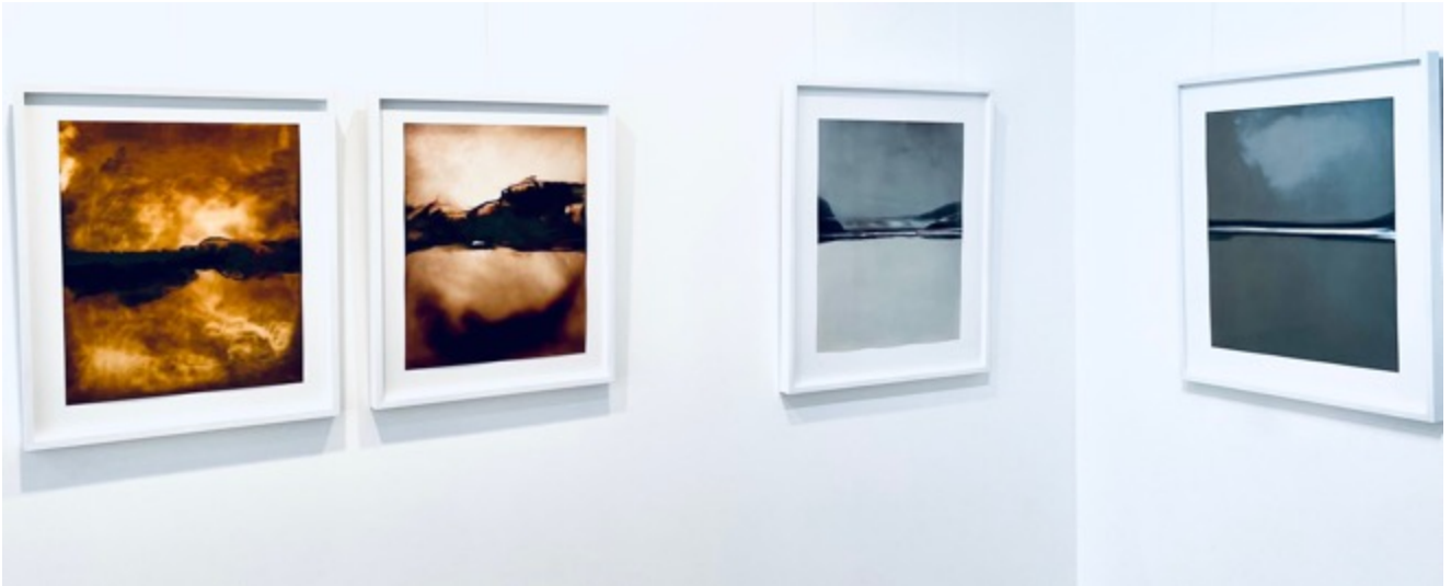
Chuck Kelton: vue d'installation, galerie éphémère à Arles, juillet 2023