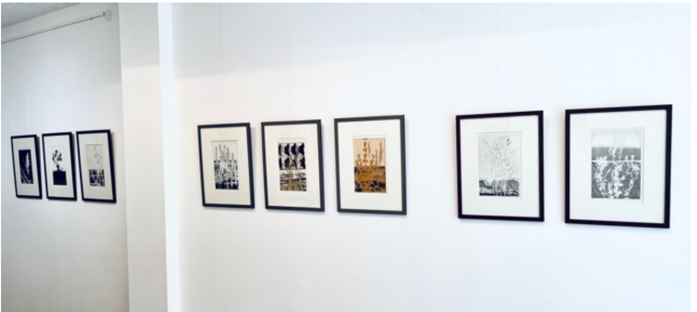
Jean-Pierre Sudre: vue d'installation, galerie éphémère à Arles, juillet 2023.