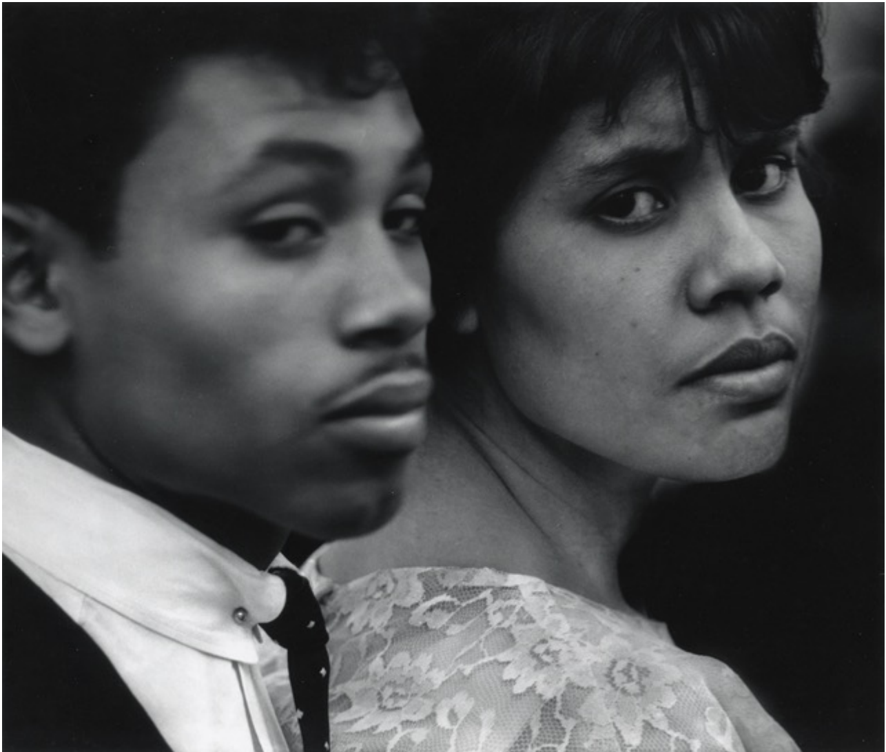
DAVE HEATH (1931-2016) Washington Square, New York City, 1960

Vintage gelatin silver print (c.1960) 7 1/2 x 9 inch (19.05 x 22.86 cm) image 8 x 10 inch (20.32 x 25.40 cm) paper Signed, titled and dated by the artist in pencil on verso