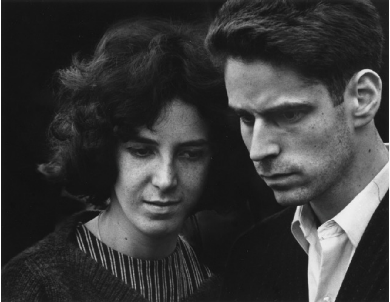
DAVE HEATH (1931-2016) New York City, c. 1960

Vintage gelatin silver print (c. 1962) 5 x 6 inch (12.70 x 15.24 cm) image 8 x 10 inch (20.32 x 25.40 cm) paper Titled, dated, and annotated, in pencil, au verso