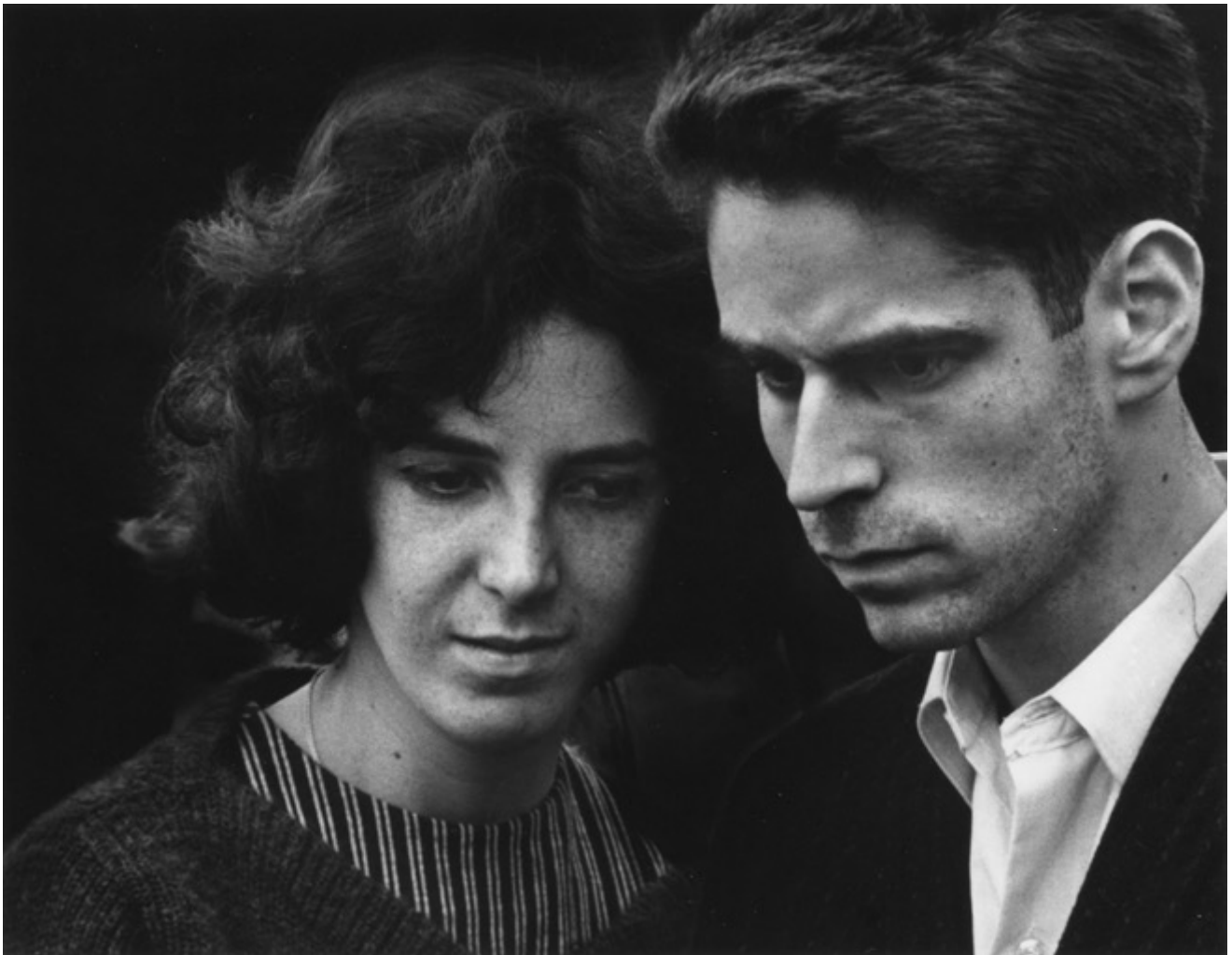
DAVE HEATH (1931-2016) New York City, 1960