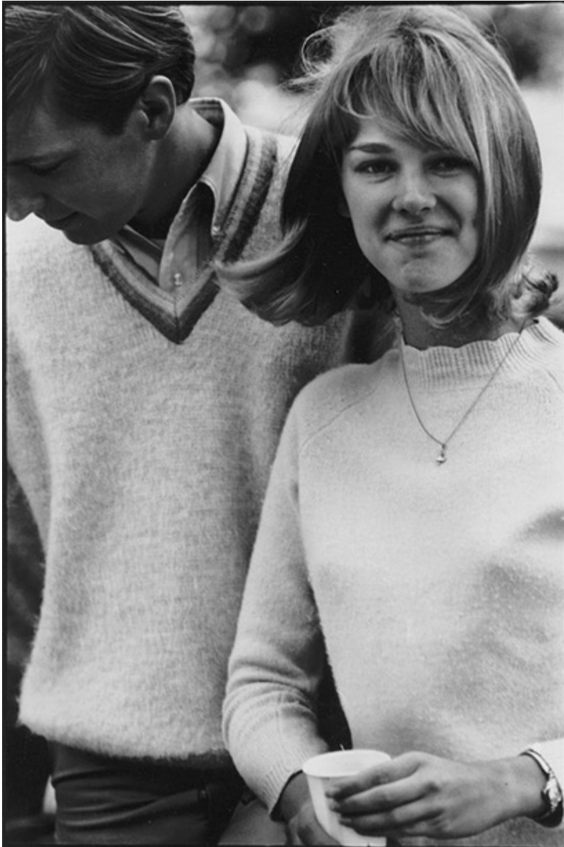
DAVE HEATH (1931-2016) Dayton, Ohio, June 1966

Vintage gelatin silver print 4 3/4 x 7 inch (12.07 x 17.78 cm) image 5 x 8 inch (12,70 x 20.32 cm) paper Printed in September 1966